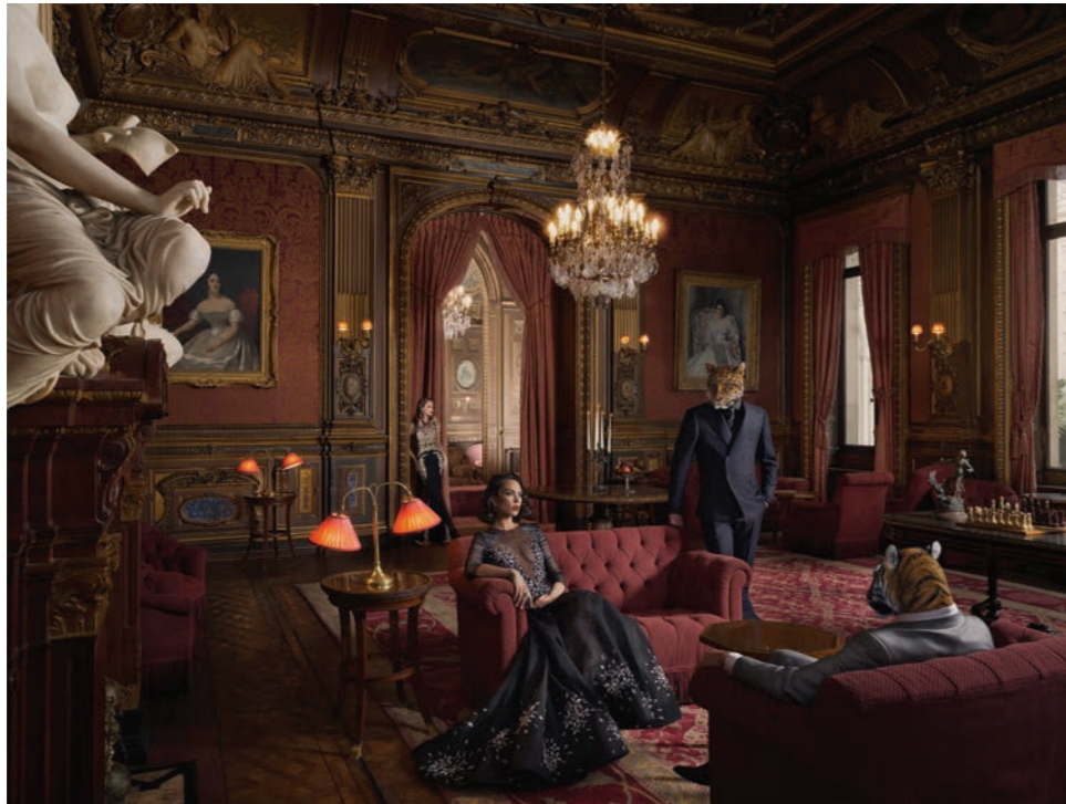
Animalité 1 Photographie 60 x 80 cm / 90 x 120 cm / 110 x 150 cm