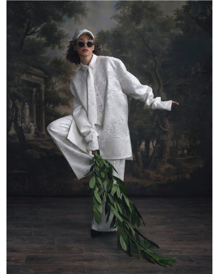
Maylys 12 Photographie 80 x 60 cm / 120 x 90 cm / 150 x 110 cm