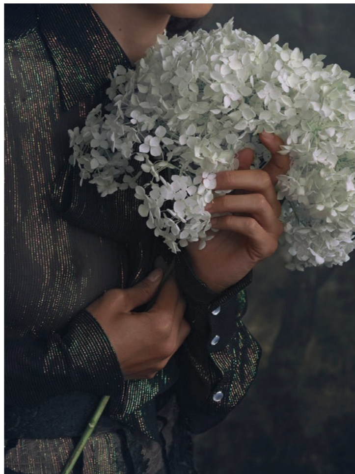
Maylys 5 Photographie 80 x 60 cm / 120 x 90 cm / 150 x 110 cm