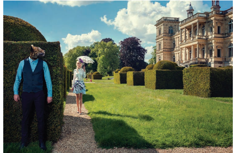
Jardin I Photographie 60 x 80 cm / 90 x 120 cm / 110 x 150 cm