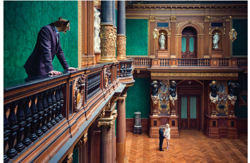
Mezzanine Photographie 60 x 80 cm / 90 x 120 cm / 110 x 150 cm