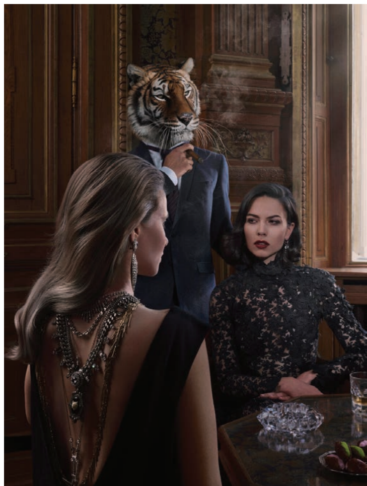
Animalité 5 Photographie 80 x 60 cm / 120 x 90 cm / 150 x 110 cm