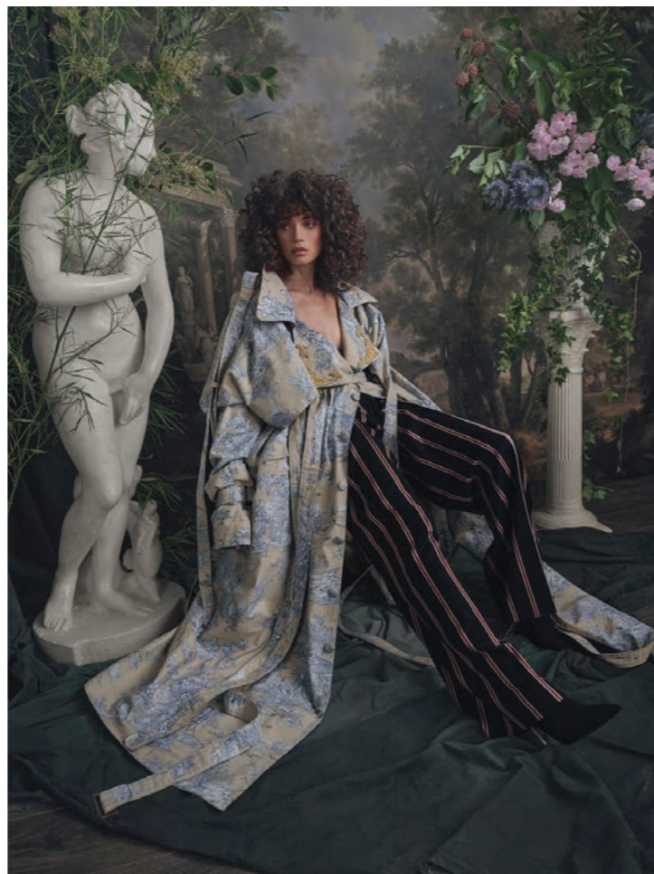
Maylys 2 Photographie 80 x 60 cm / 120 x 90 cm / 150 x 110 cm