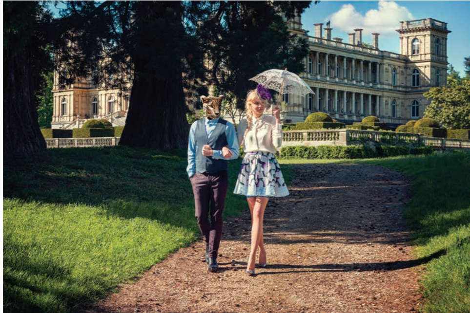
Jardin 2 Photographie 60 x 80 cm / 90 x 120 cm / 110 x 150 cm