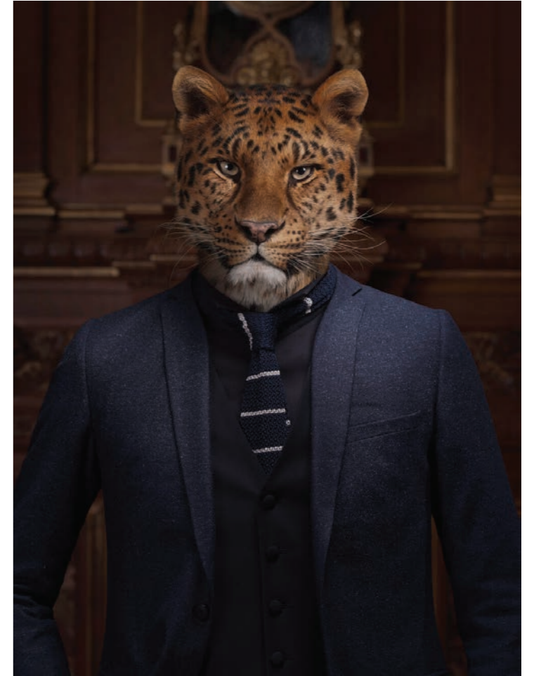
Animalité 11 - Portrait 4 Photographie 80 x 60 cm / 120 x 90 cm / 150 x 110 cm