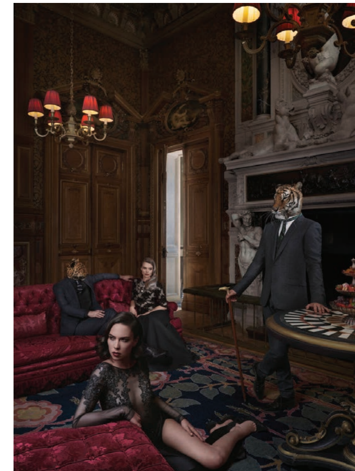
Animalité 7 Photographie 80 x 60 cm / 120 x 90 cm / 150 x 110 cm