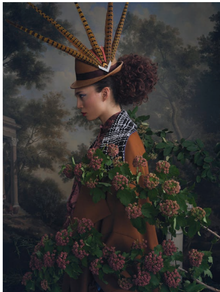
Maylys 7 Photographie 80 x 60 cm / 120 x 90 cm / 150 x 110 cm