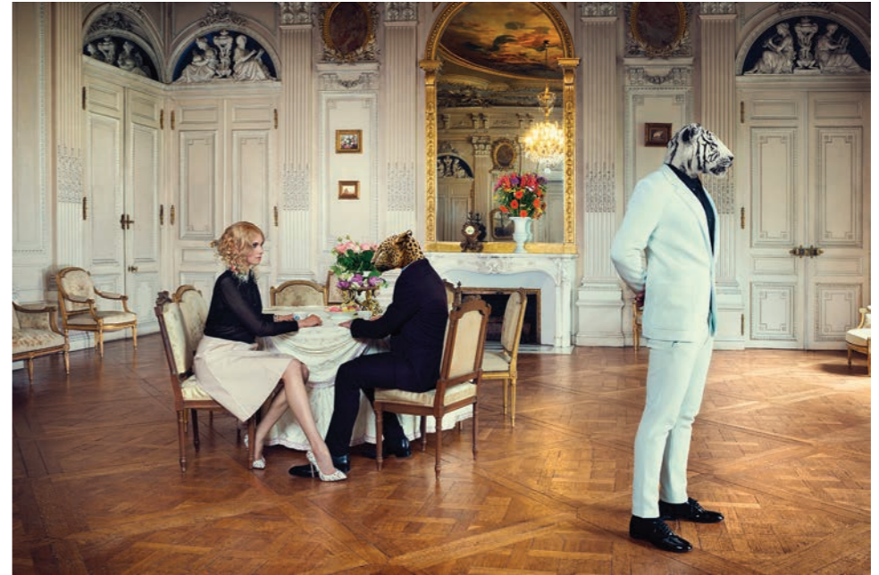
Grand salon Photographie 60 x 80 cm / 90 x 120 cm / 110 x 150 cm