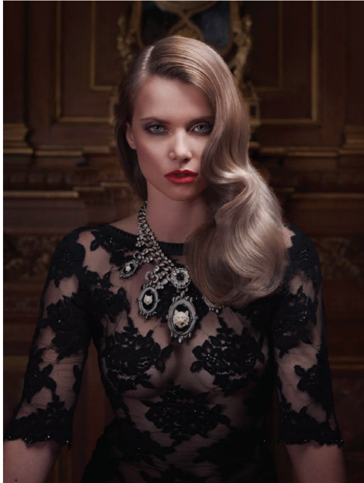
Animalité 8 - Portrait 1 Photographie 80 x 60 cm / 120 x 90 cm / 150 x 110 cm