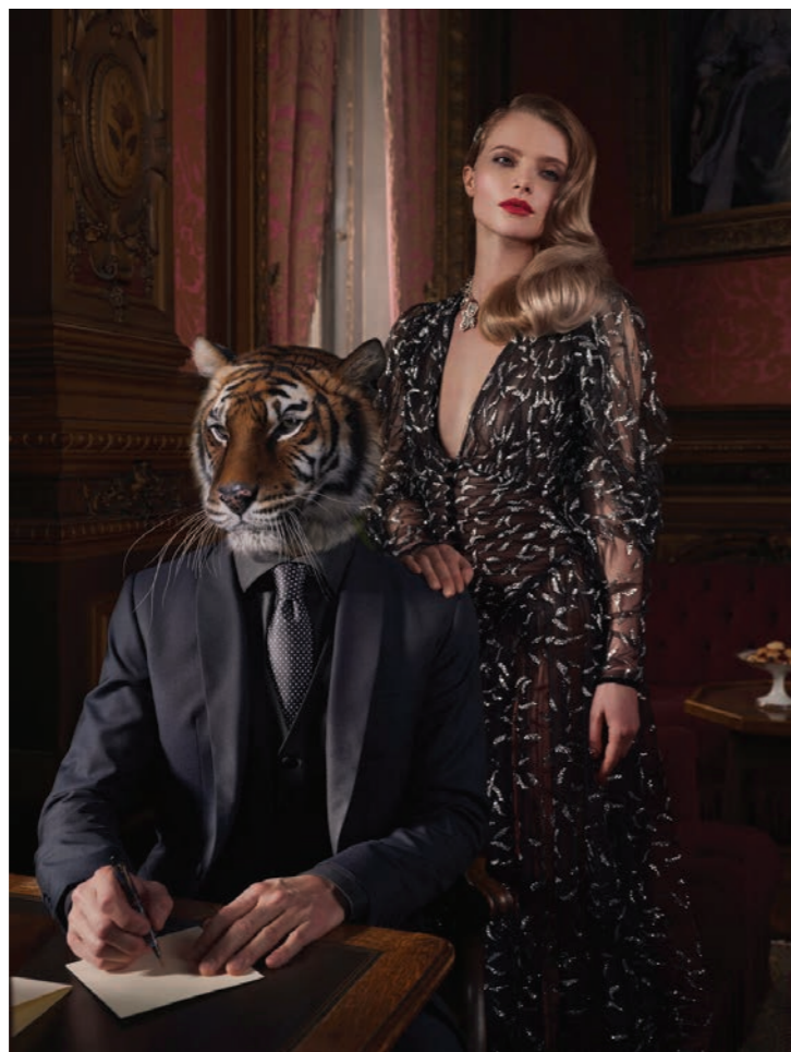
Animalité 3 Photographie 80 x 60 cm / 120 x 90 cm / 150 x 110 cm