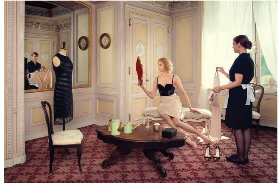
Boudoir Photographie 60 x 80 cm / 90 x 120 cm / 110 x 150 cm