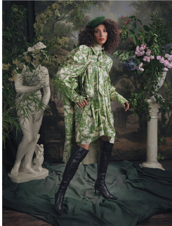
Maylys 10 Photographie 80 x 60 cm / 120 x 90 cm / 150 x 110 cm