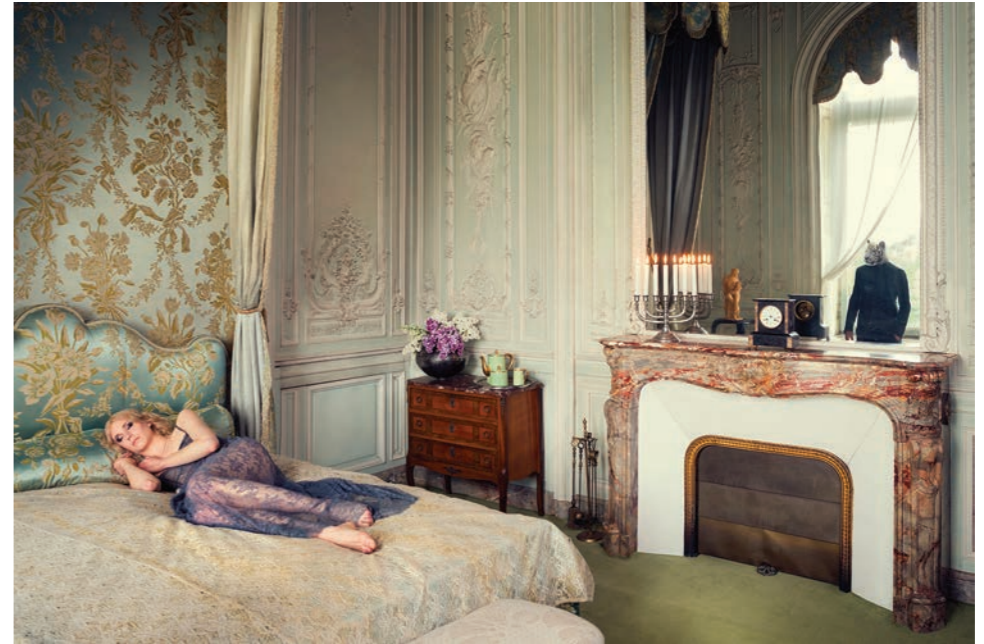
Lit, comtesse Photographie 60 x 80 cm / 90 x 120 cm / 110 x 150 cm