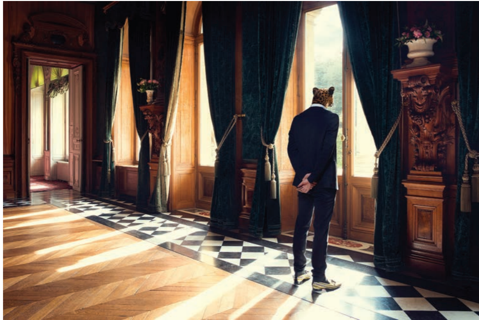
Fenêtre 1 Photographie 60 x 80 cm / 90 x 120 cm / 110 x 150 cm