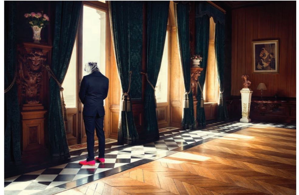
Fenêtre 2 Photographie 60 x 80 cm / 90 x 120 cm / 110 x 150 cm