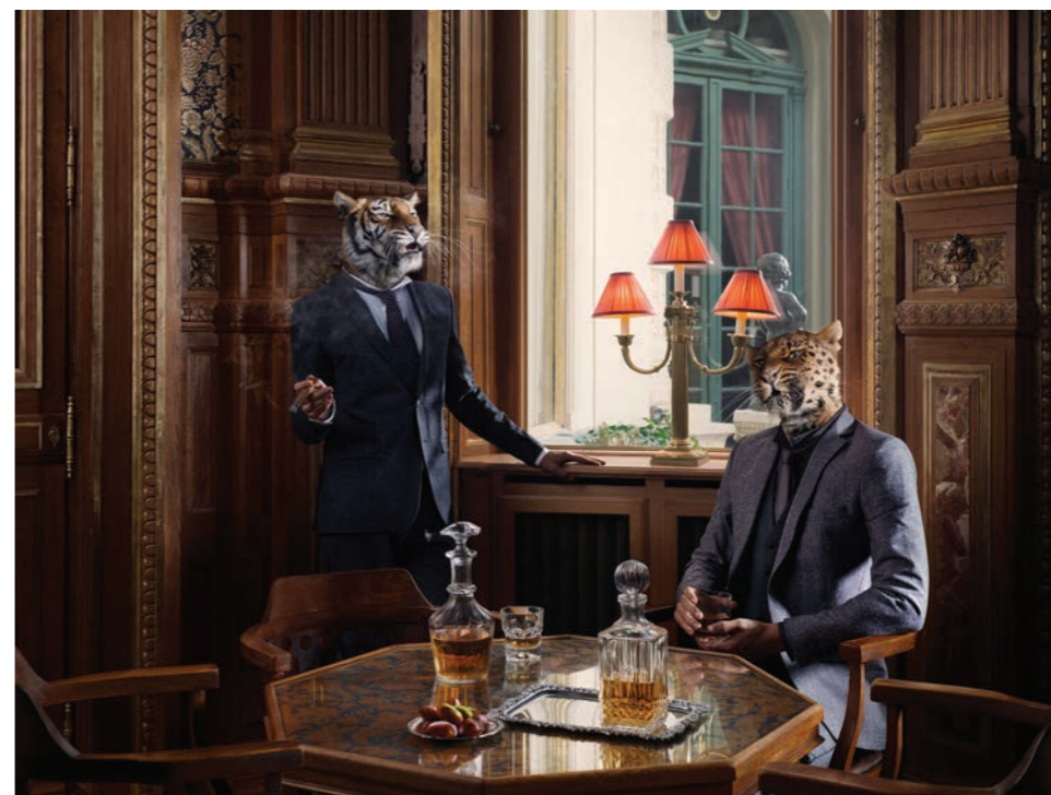
Animalité 4 Photographie 60 x 80 cm / 90 x 120 cm / 110 x 150 cm