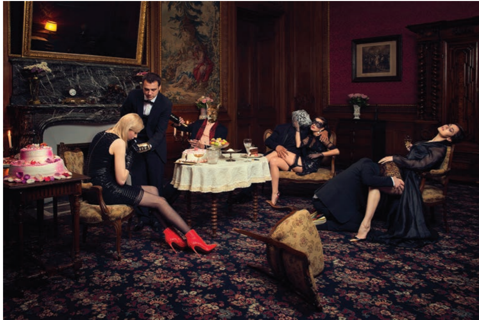
Soirée 2 Photographie 60 x 80 cm / 90 x 120 cm / 110 x 150 cm