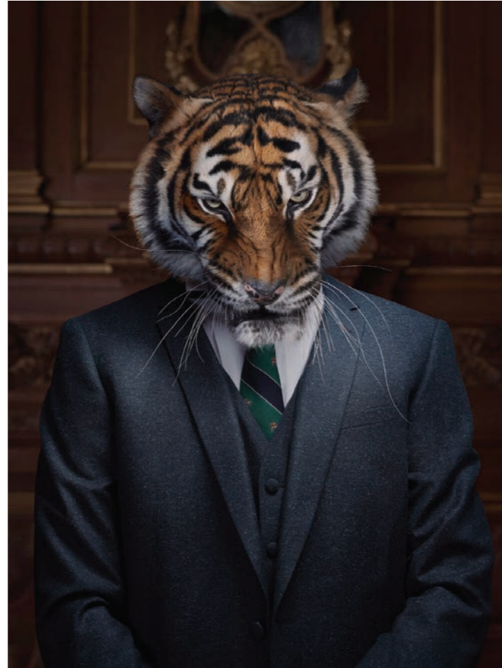
Animalité 9 - Portrait 2 Photographie 80 x 60 cm / 120 x 90 cm / 150 x 110 cm