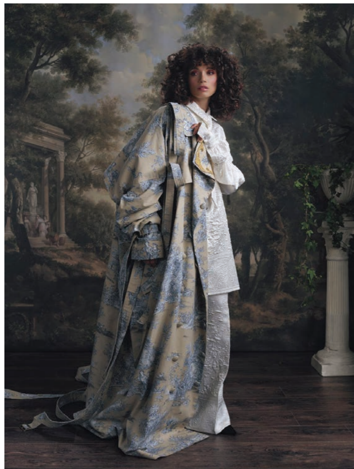
Maylys 1 Photographie 80 x 60 cm / 120 x 90 cm / 150 x 110 cm