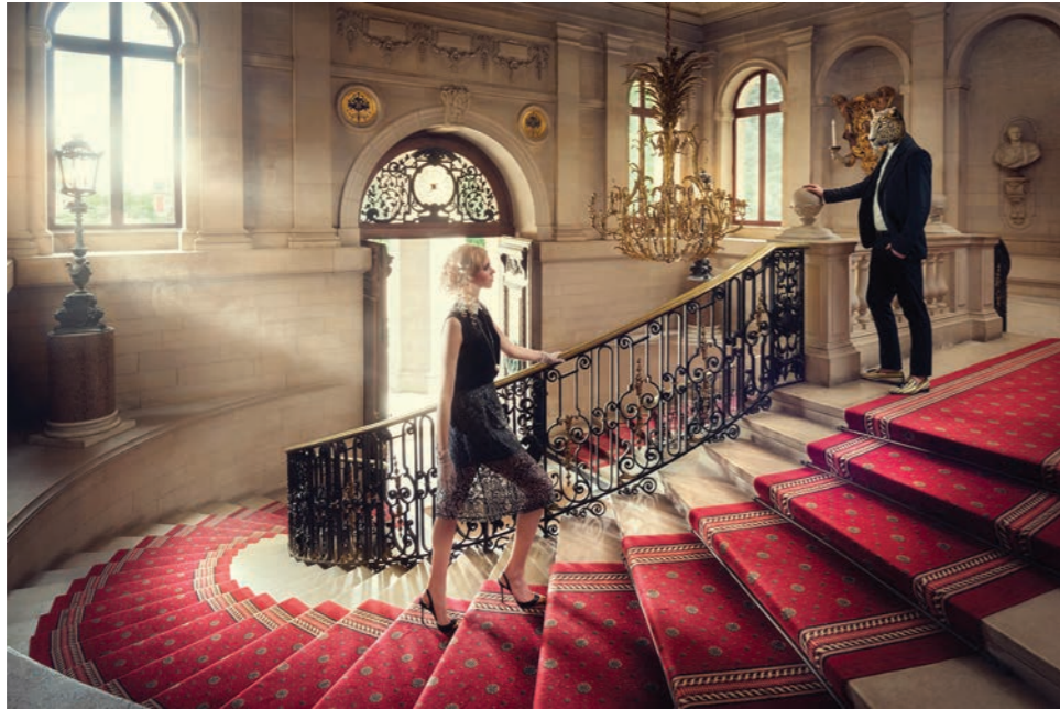
Grand escalier Photographie 60 x 80 cm / 90 x 120 cm / 110 x 150 cm