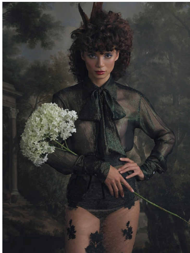
Maylys 4 Photographie 80 x 60 cm / 120 x 90 cm / 150 x 110 cm