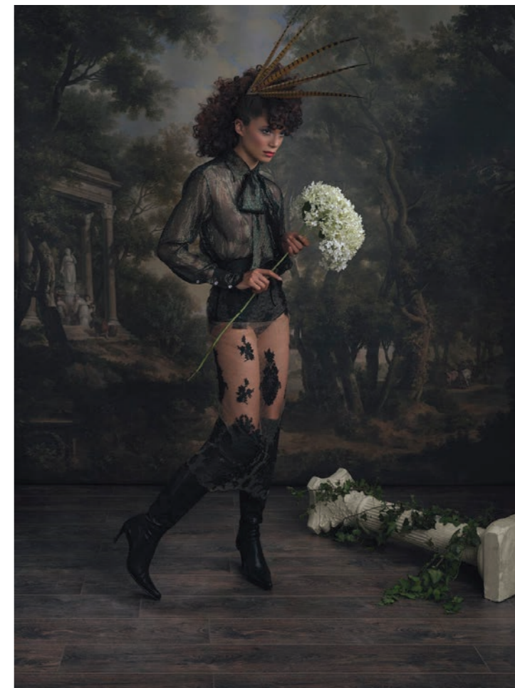
Maylys 3 Photographie 80 x 60 cm / 120 x 90 cm / 150 x 110 cm