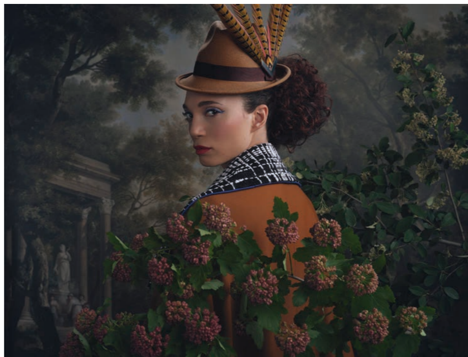
Maylys 8 Photographie 80 x 60 cm / 120 x 90 cm / 150 x 110 cm