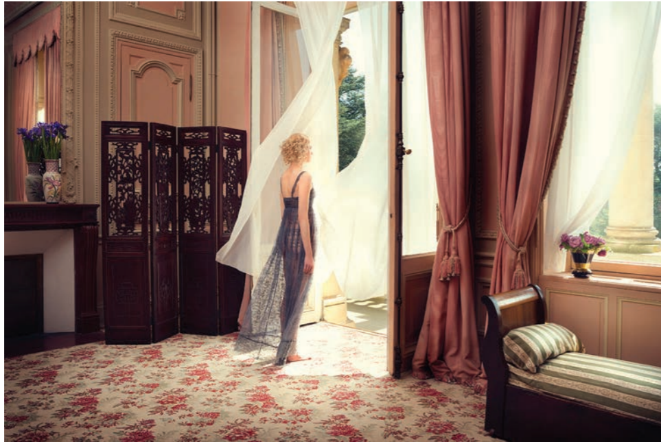
Chambre, comtesse Photographie 60 x 80 cm / 90 x 120 cm / 110 x 150 cm