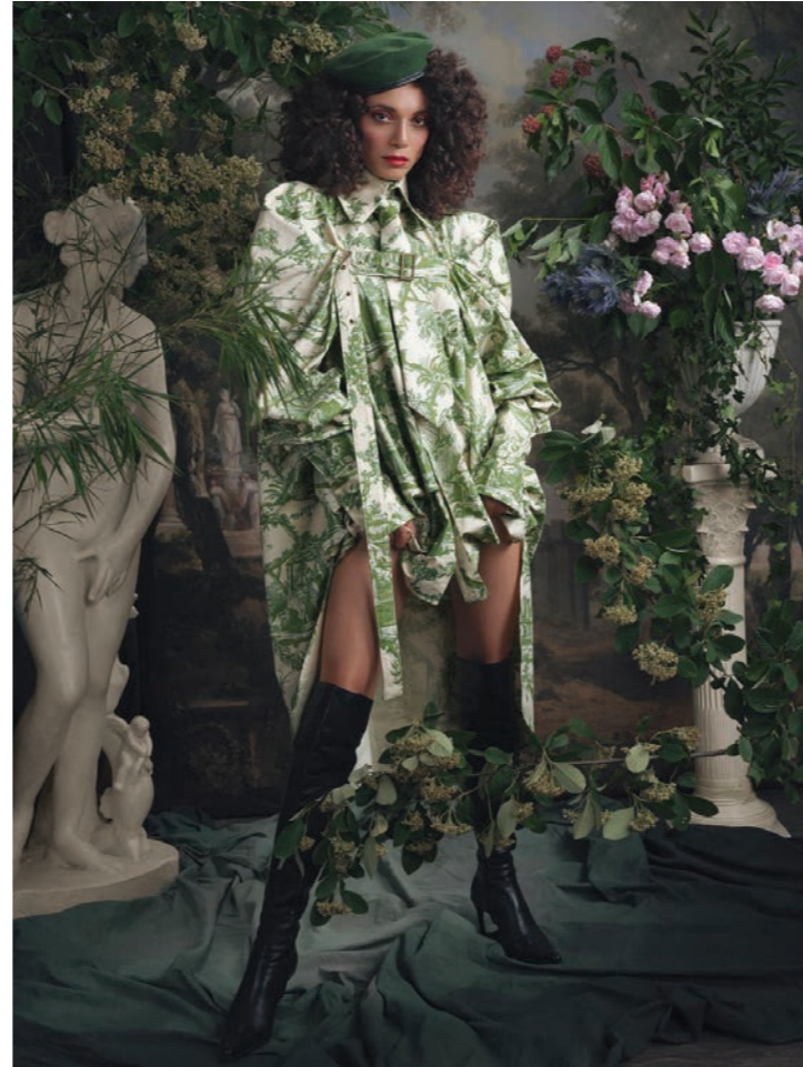
Maylys 11 Photographie 80 x 60 cm / 120 x 90 cm / 150 x 110 cm