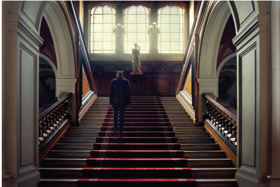
Escalier Photographie 60 x 80 cm / 90 x 120 cm / 110 x 150 cm