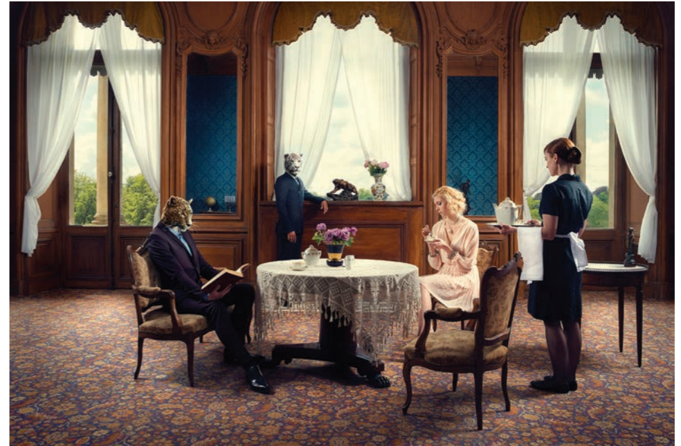
Salon de thé Photographie 60 x 80 cm / 90 x 120 cm / 110 x 150 cm