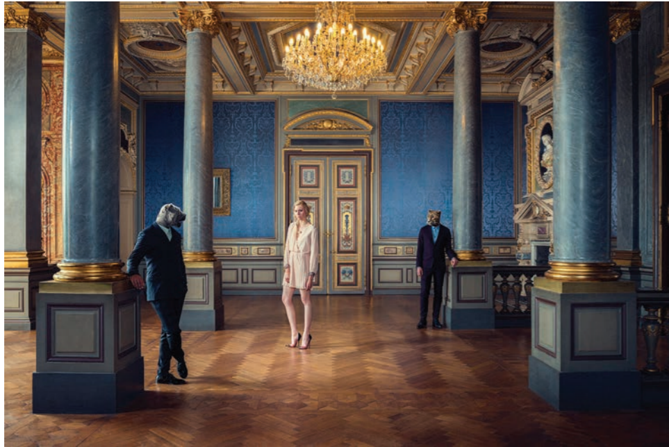
Colonne Photographie 60 x 80 cm / 90 x 120 cm / 110 x 150 cm