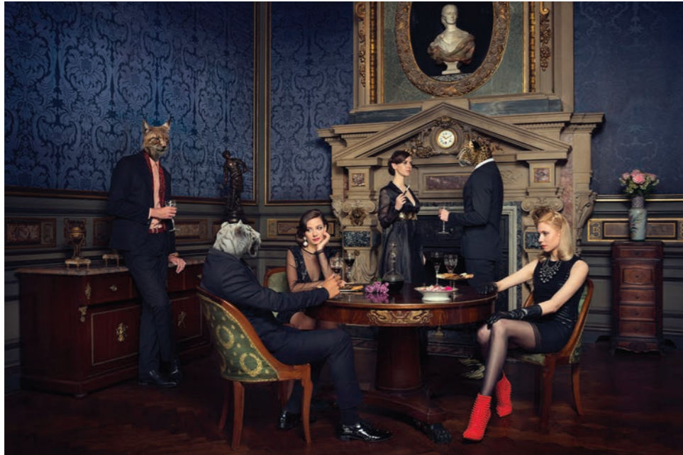
Apéro Photographie 60 x 80 cm / 90 x 120 cm / 110 x 150 cm