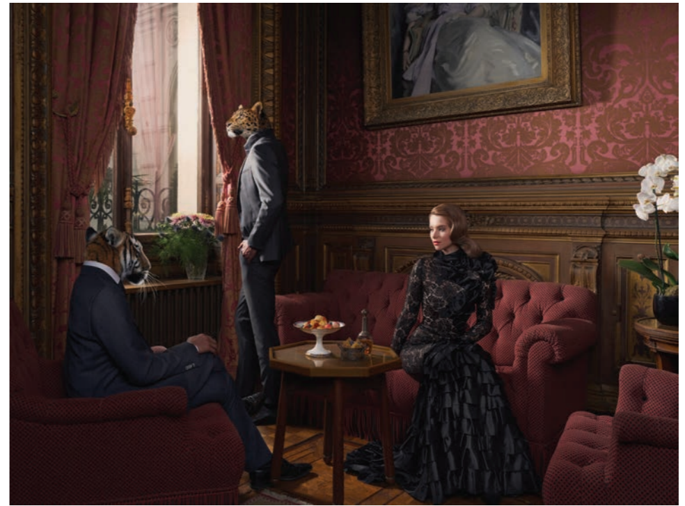
Animalité 2 Photographie 60 x 80 cm / 90 x 120 cm / 110 x 150 cm