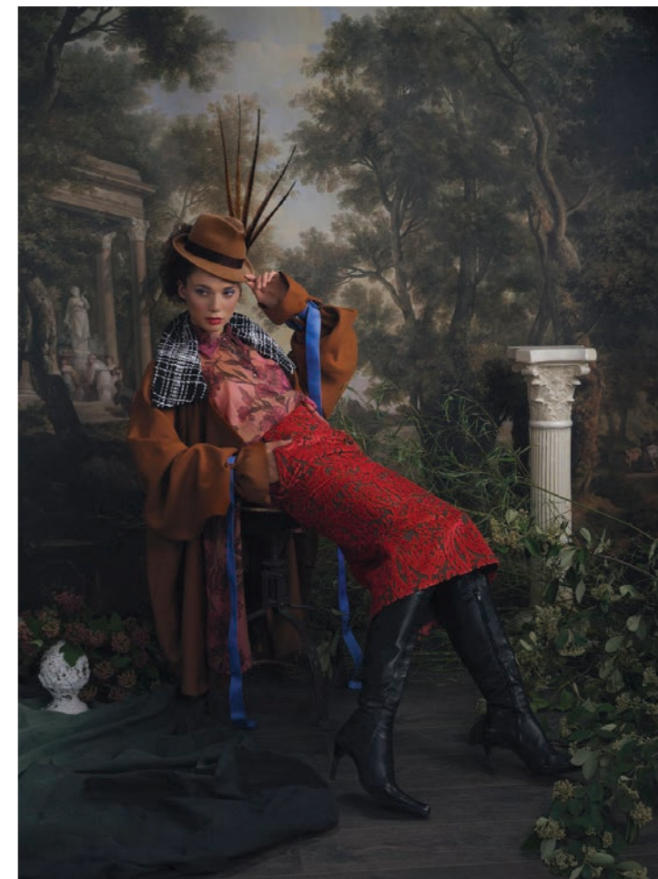
Maylys 6 Photographie 80 x 60 cm / 120 x 90 cm / 150 x 110 cm