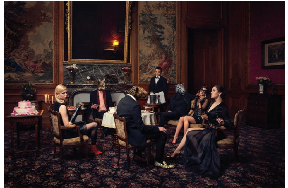
Soirée I Photographie 60 x 80 cm / 90 x 120 cm / 110 x 150 cm