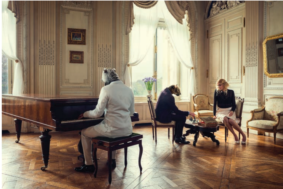
Piano Photographie 60 x 80 cm / 90 x 120 cm / 110 x 150 cm