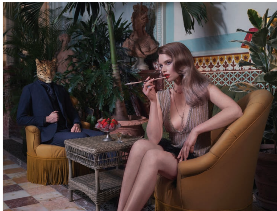
Animalité 6 Photographie 60 x 80 cm / 90 x 120 cm / 110 x 150 cm