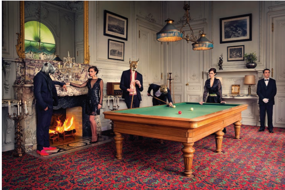
Billard Photographie 60 x 80 cm / 90 x 120 cm / 110 x 150 cm