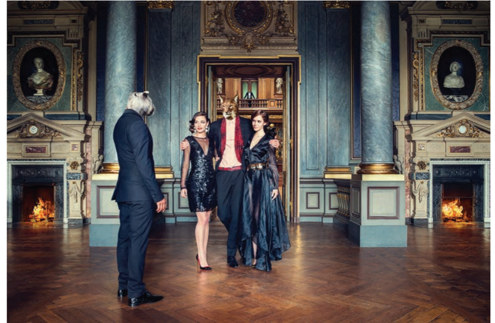
Arrivée, colonnes Photographie 60 x 80 cm / 90 x 120 cm / 110 x 150 cm