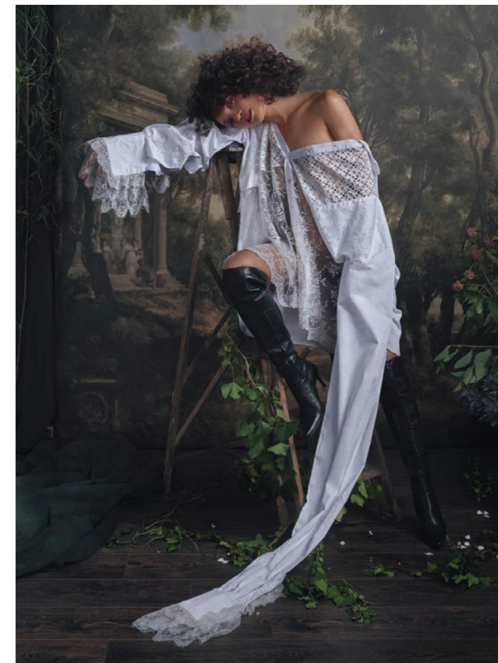
Maylys 9 Photographie 80 x 60 cm / 120 x 90 cm / 150 x 110 cm