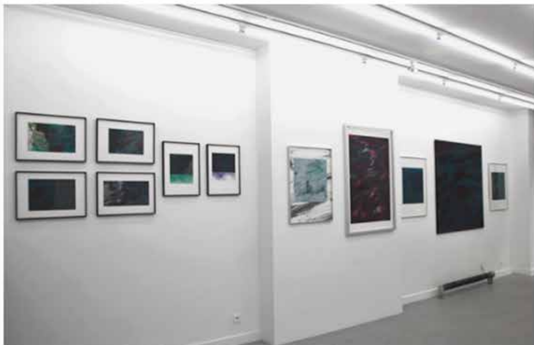
Galerie Gilbert Dufois - la Nature au Carré