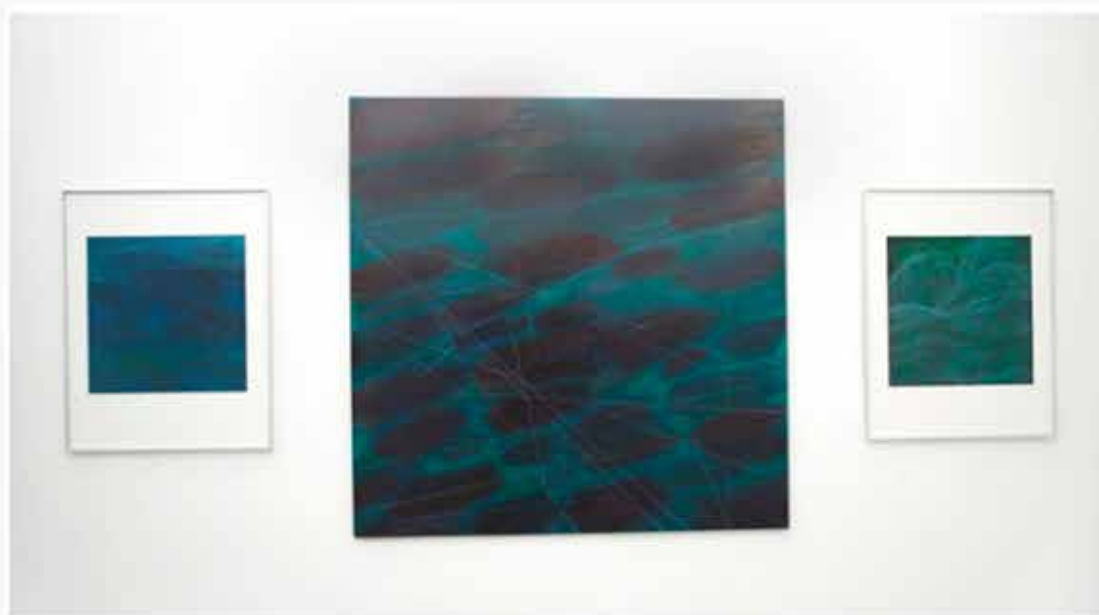
Galerie Gilbert Dufois - la Nature au Carré - Olivier Moriette ©

L'une des particularités d' Olivier Moriette est l'utilisation du carré comme cadrage de presque toutes les peintures et estampes de cette série. Cela pose la question tout à fait contemporaine de l'utilisation de certains formats sur les réseaux sociaux. Cette volonté de l'usage du carré rend compte du changement de perception de l'image. La vision du paysage est renouvelée par les diverses techniques artistiques d' Olivier Moriette qui laisse place à l'imagination de chacun pour retranscrire, dans le réel, les œuvres de l'artiste.