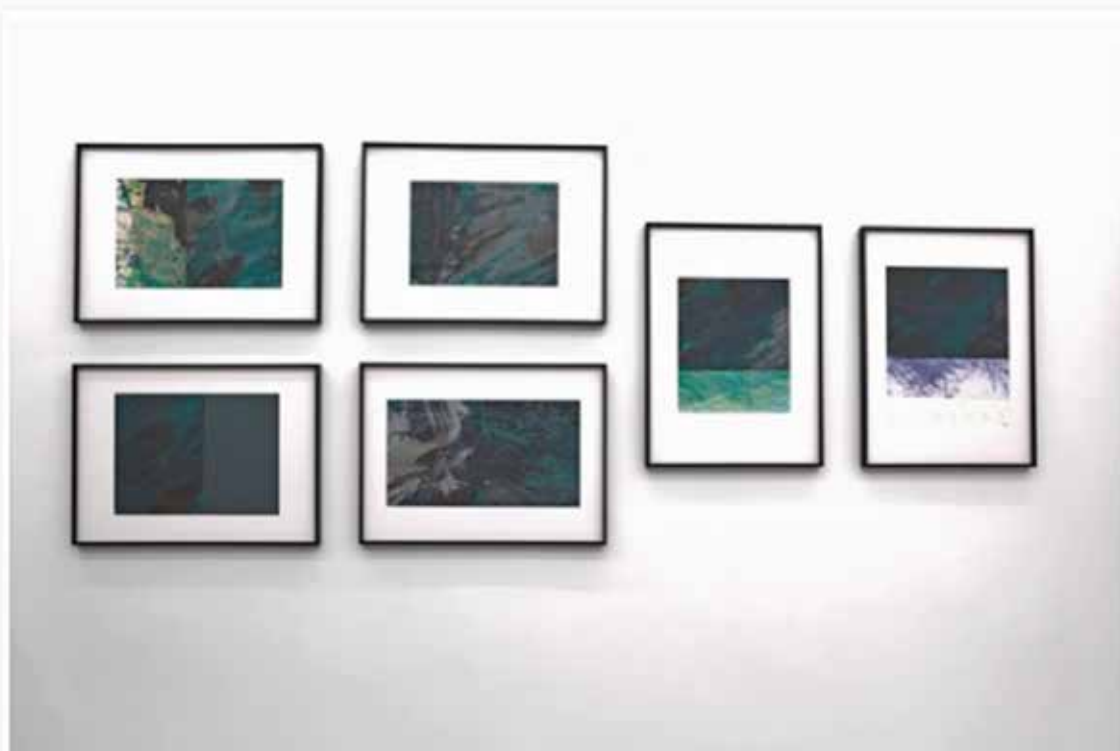
Galerie Gilbert Dufois – la Nature au Carré -Olivier Moriette ©

L'artiste se met dans la peau des regardeurs, de ceux qui tentent de se souvenir d'un paysage, d'un mouvement ou d'un détail. De plus, Olivier Moriette retranscrit le paysage dans ses œuvres de telle manière qu'il mélange figuratif et abstrait : cela s'exprime par les points de fuite représentant la perspective ainsi que les couleurs très sombres utilisées dans cette série. Les deux mouvements artistiques (abstrait et figuratif) semblent inconciliables, et pourtant, c'est bien ce mélange entre inspiration d'estampes japonaises et art moderne qui permet de rendre les œuvres d' Olivier Moriette uniques. Cette transcription du paysage est une forme de construction mentale : elle permet une étude plus approfondie de l'espace et de la lumière et une réflexion de la part du public.