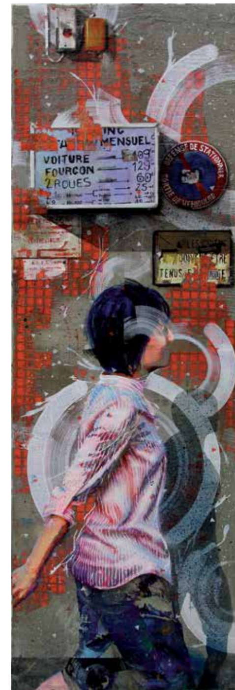
Début timide , acrylique, résine et ciment sur toile, 120 x 40 cm