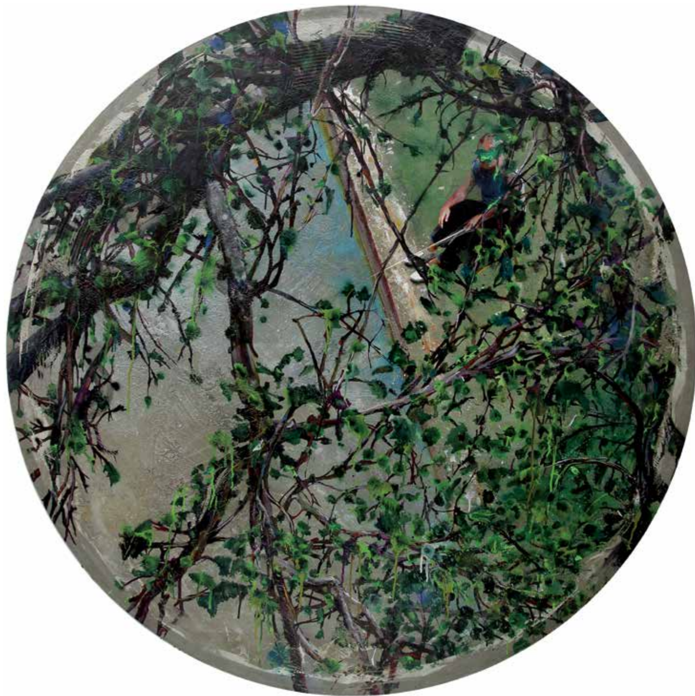
Dans les arbres , résine et ciment sur toile, diamètre : 130 cm