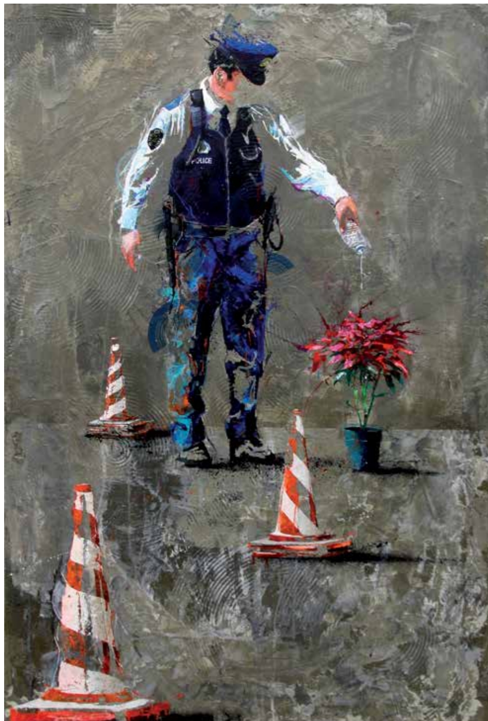
BIO COP , acrylique, résine et ciment sur toile, 130 x 89 cm