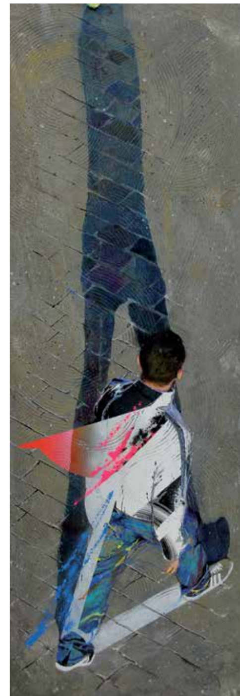
Gustave, acrylique, résine et ciment sur toile, 150 x 50 cm