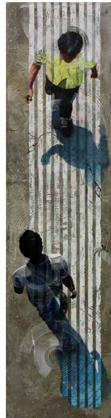
Stand high , acrylique, résine et ciment sur toile, 180 x 30 cm / Coup de peau , acrylique, résine et ciment sur toile, 132 x 35 cm