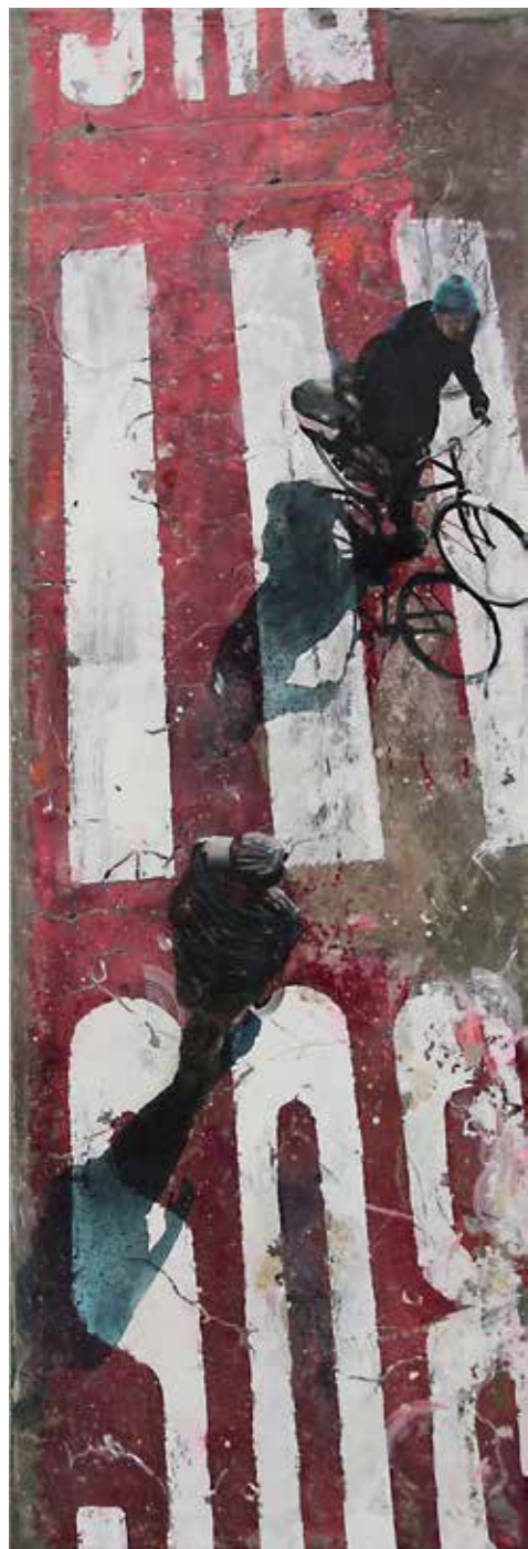
Voir sans être vu, acrylique, résine et ciment sur toile, 150 x 50 cm

Pour sa première exposition personnelle dans la galerie parisienne Gilbert Dufois, Arnaud Liard prend de la hauteur, jusqu'à nous donner le vertige. Habitué à retranscrire l'ADN de la ville, il a cette fois choisi un nouveau point de vue. Comme un oiseau perché sur sa branche, il a observé la fourmilière urbaine en toute discrétion. Flâneurs, travailleurs, fonctionnaires de police, marchands, coursiers... Autant de petites figurines qui s'affairent sous l'œil enfantin de l'artiste. Fidèle à un processus établi de longue date, il les a photographiés, étudiés puis retranscrits sur la toile.