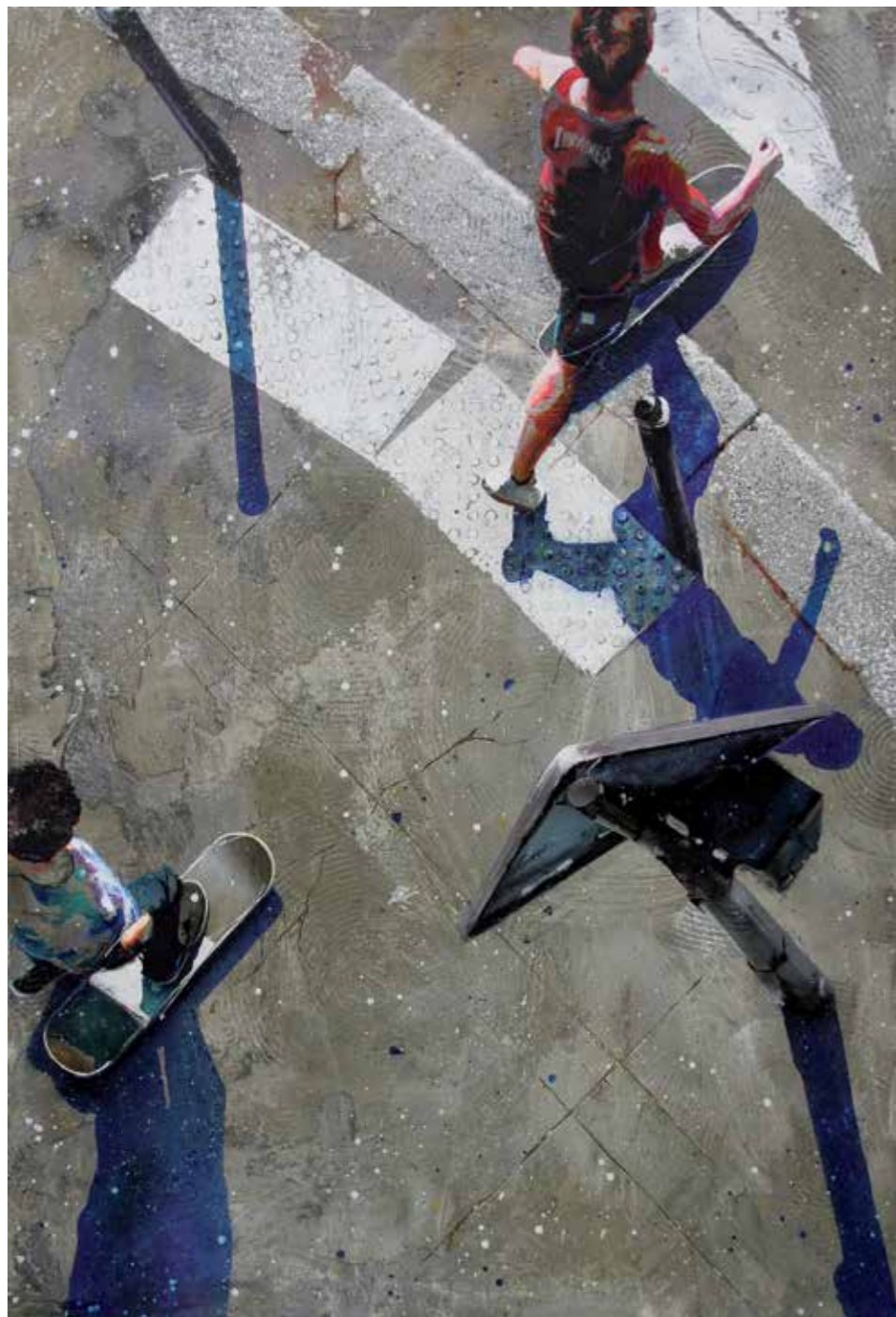
Ride, acrylique, résine et ciment sur toile, 130 x 89 cm