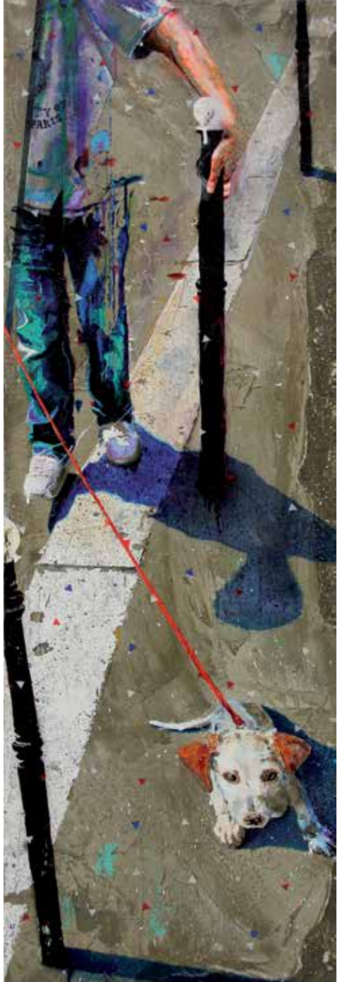
En équilibre , acrylique, résine et ciment sur toile, 120 x 40 cm