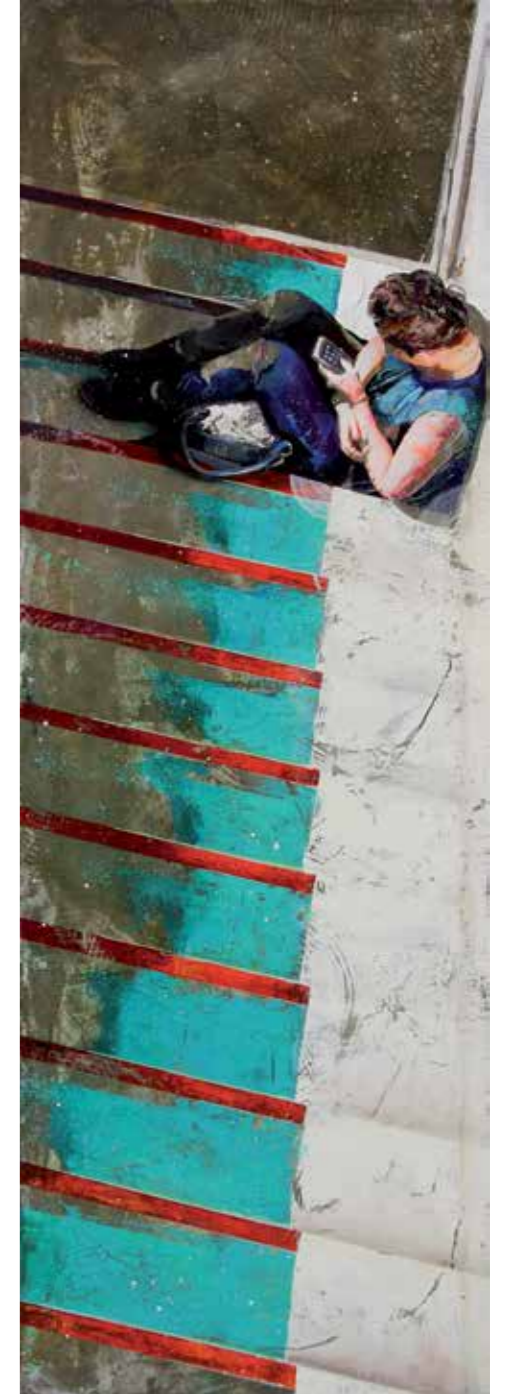
Le monde est devant toi , acrylique, résine et ciment sur toile, 150 x 50 cm