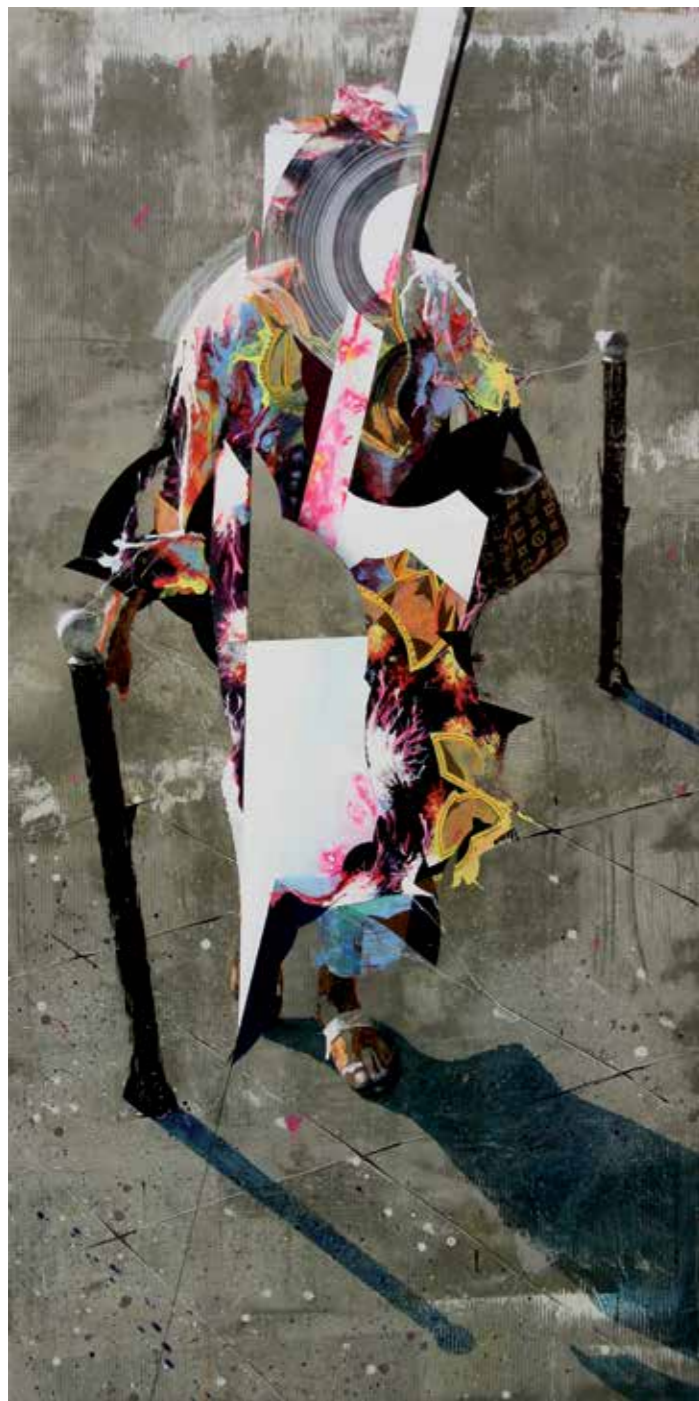
La dame de Lyon , acrylique, résine et ciment sur toile, 120 x 60 cm