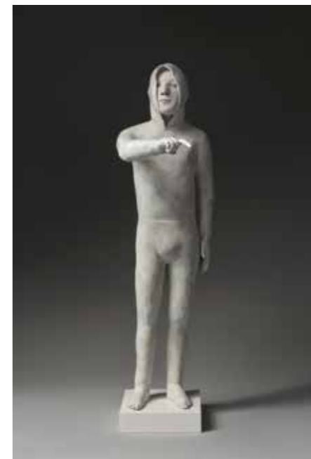
Un jeune Bronze Hauteur : 42 cm Édition de 8 + 4 E.A.