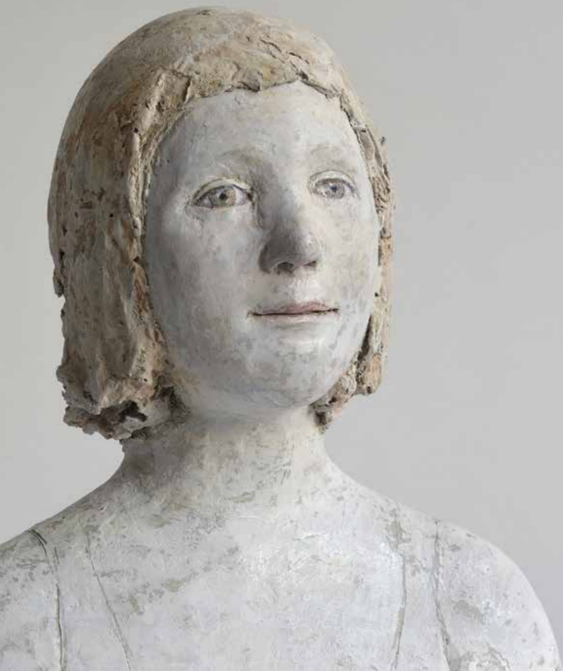
Buste de jeune fille Papier mâché Hauteur : 23 cm Pièce unique