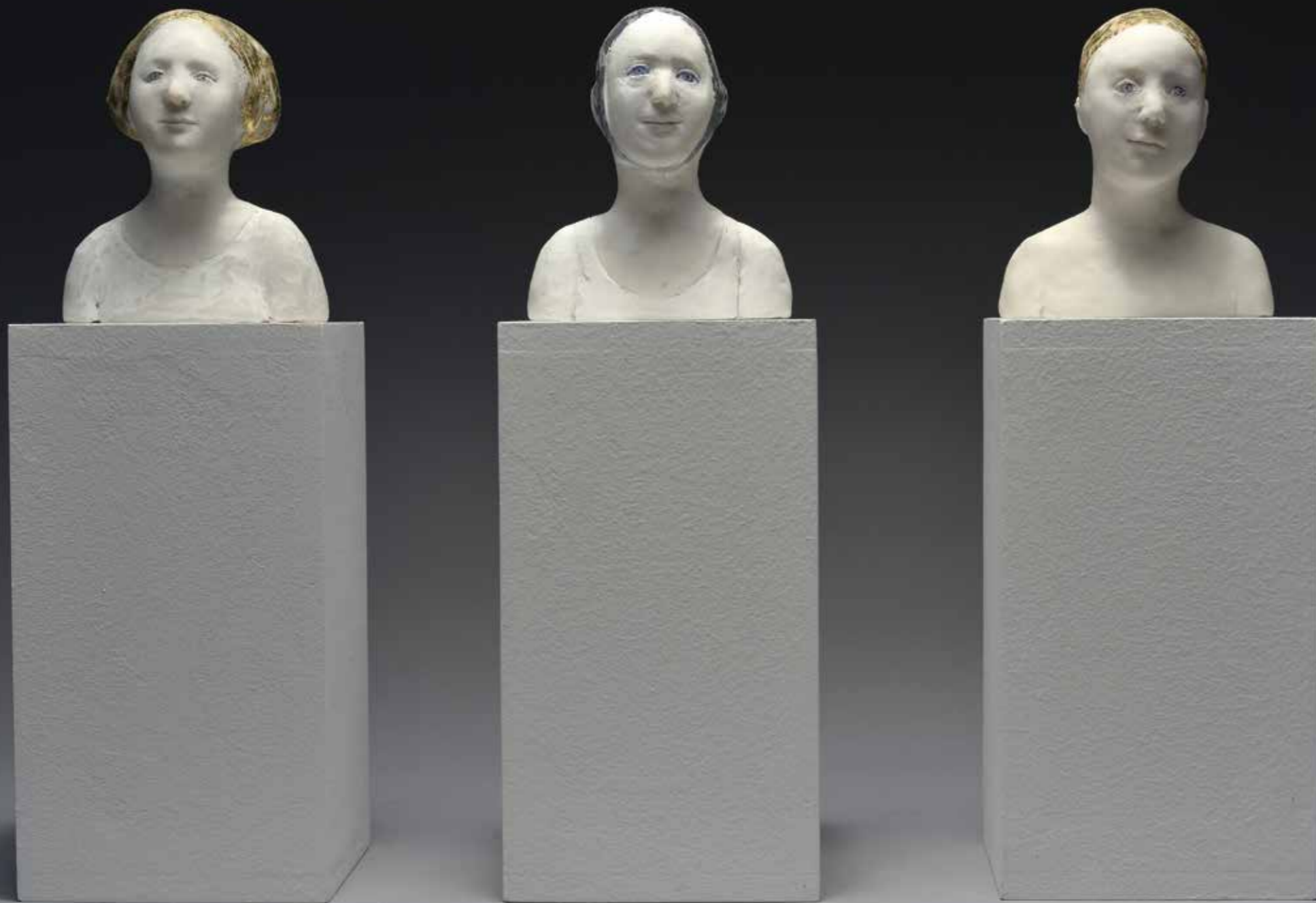
Trois petits bustes avec coiffe dorée et argentée Résine Hauteur : 12 cm Pièces uniques