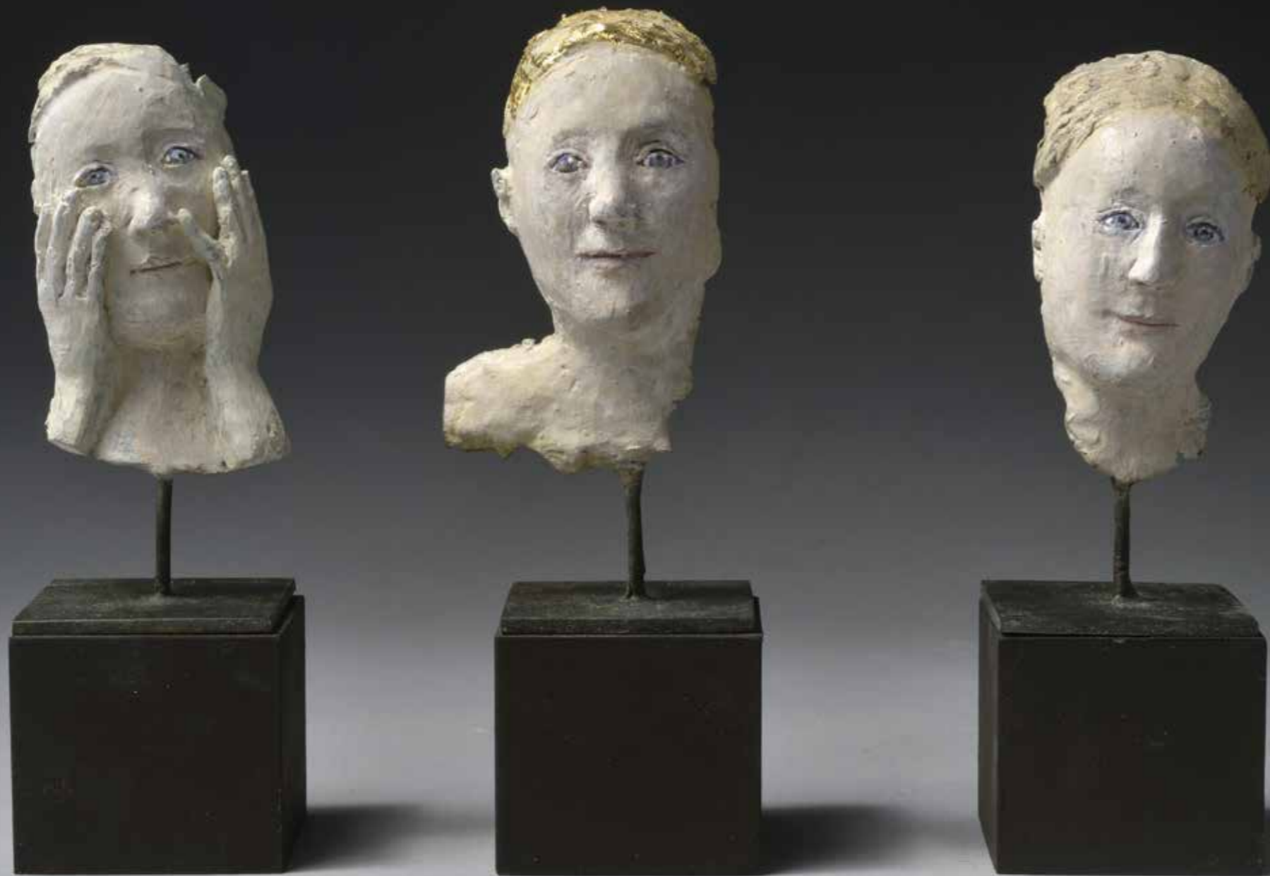
Trois petits fragments de tête Bronze Hauteur : 12 cm Pièces uniques