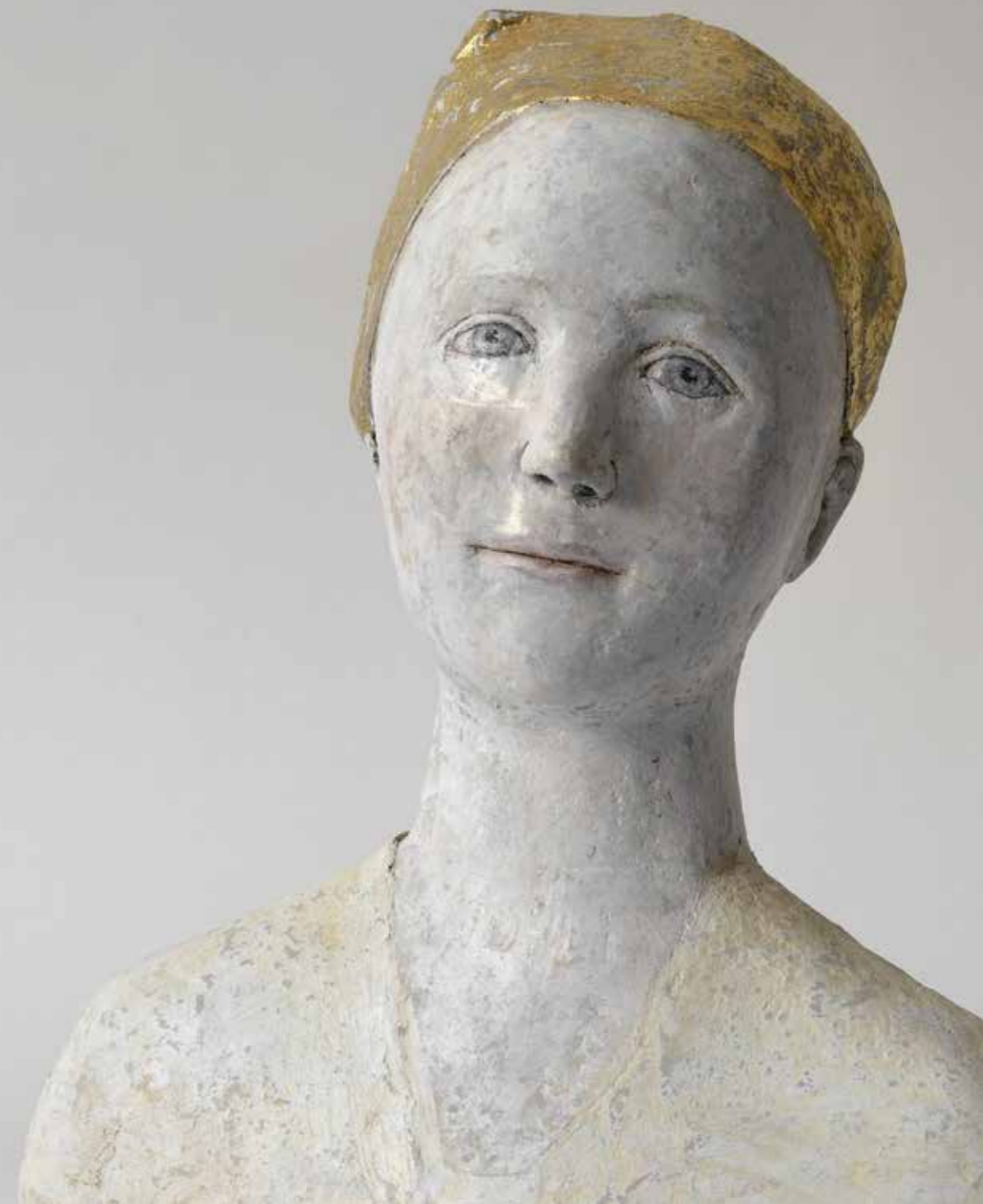
Buste de reine dorée Papier mâché Hauteur : 26 cm Pièce unique