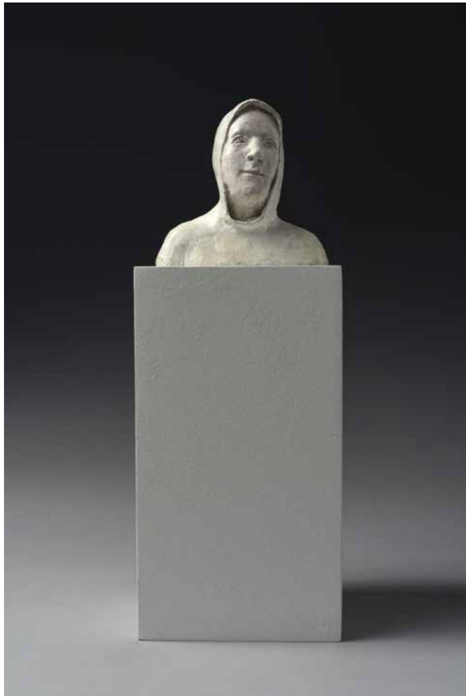
Petit buste de jeune Bronze Hauteur : 10 cm Pièce unique