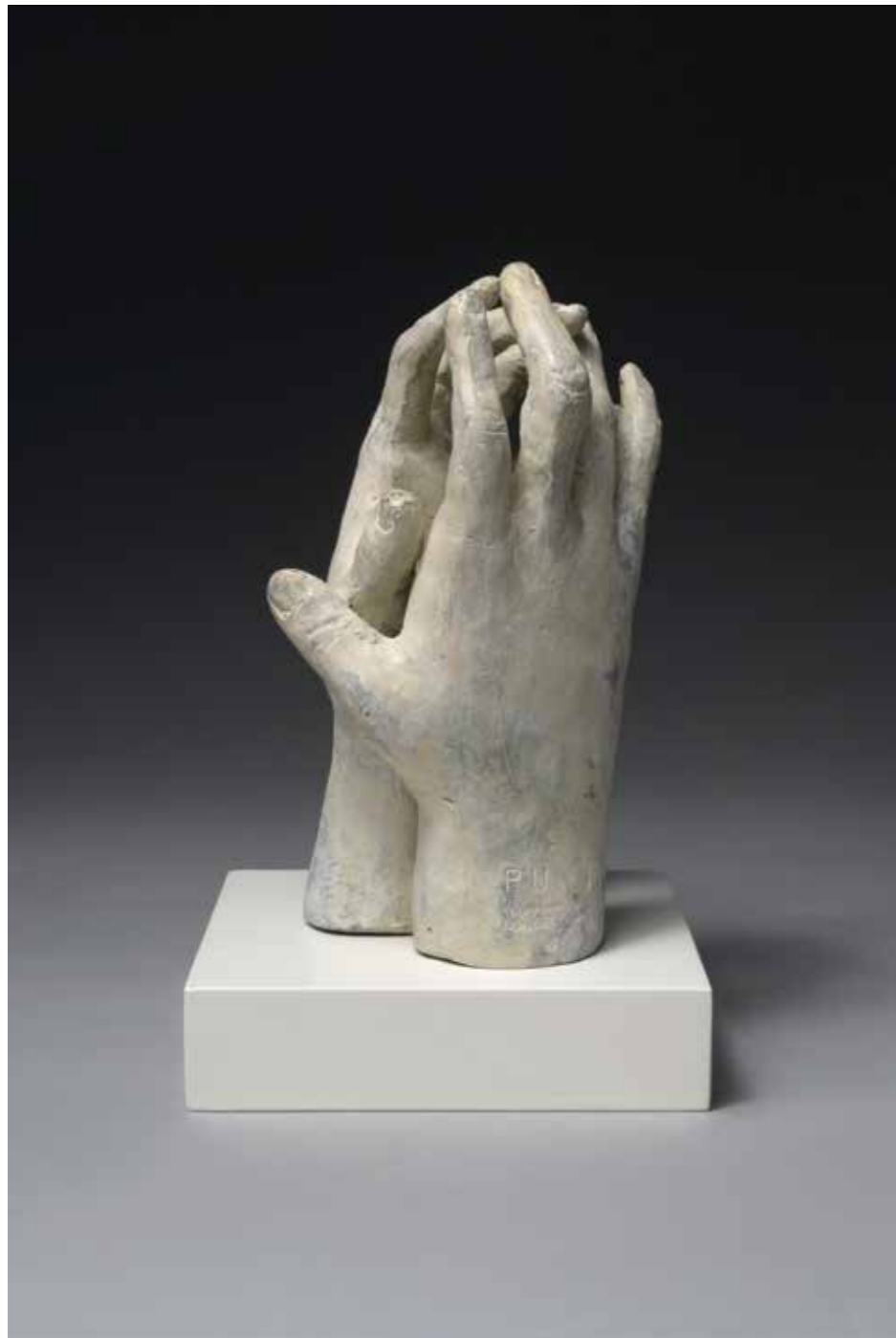
Mains entrelacées Bronze Hauteur : 13 cm Pièce unique