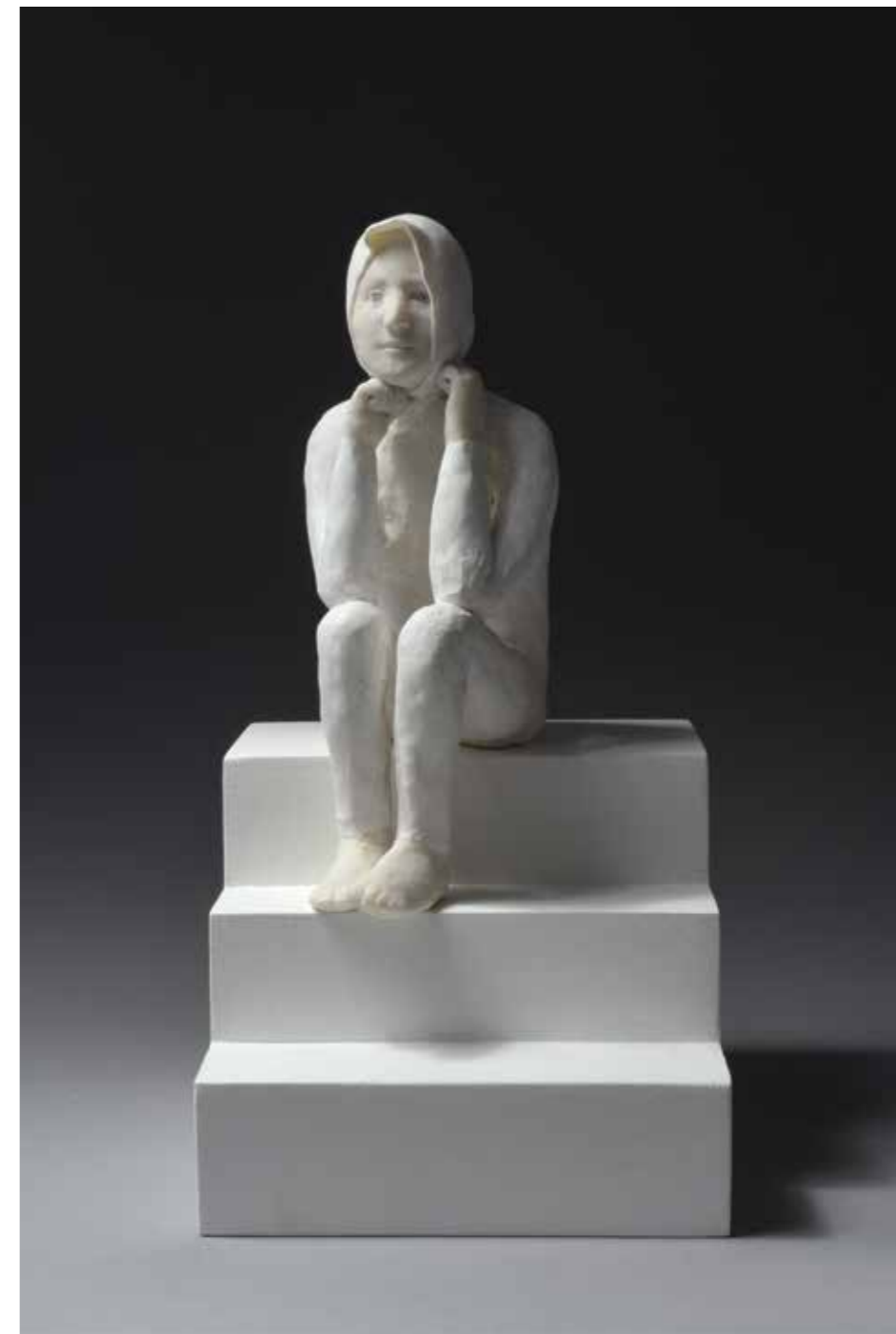
Jeune pensif sur trois marches Résine Hauteur avec escalier : 39 cm Pièce unique