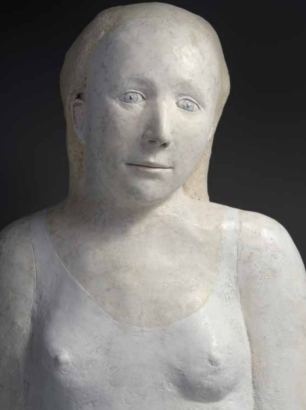
Grand buste de femme Papier mâché Hauteur : 70 cm Pièce unique