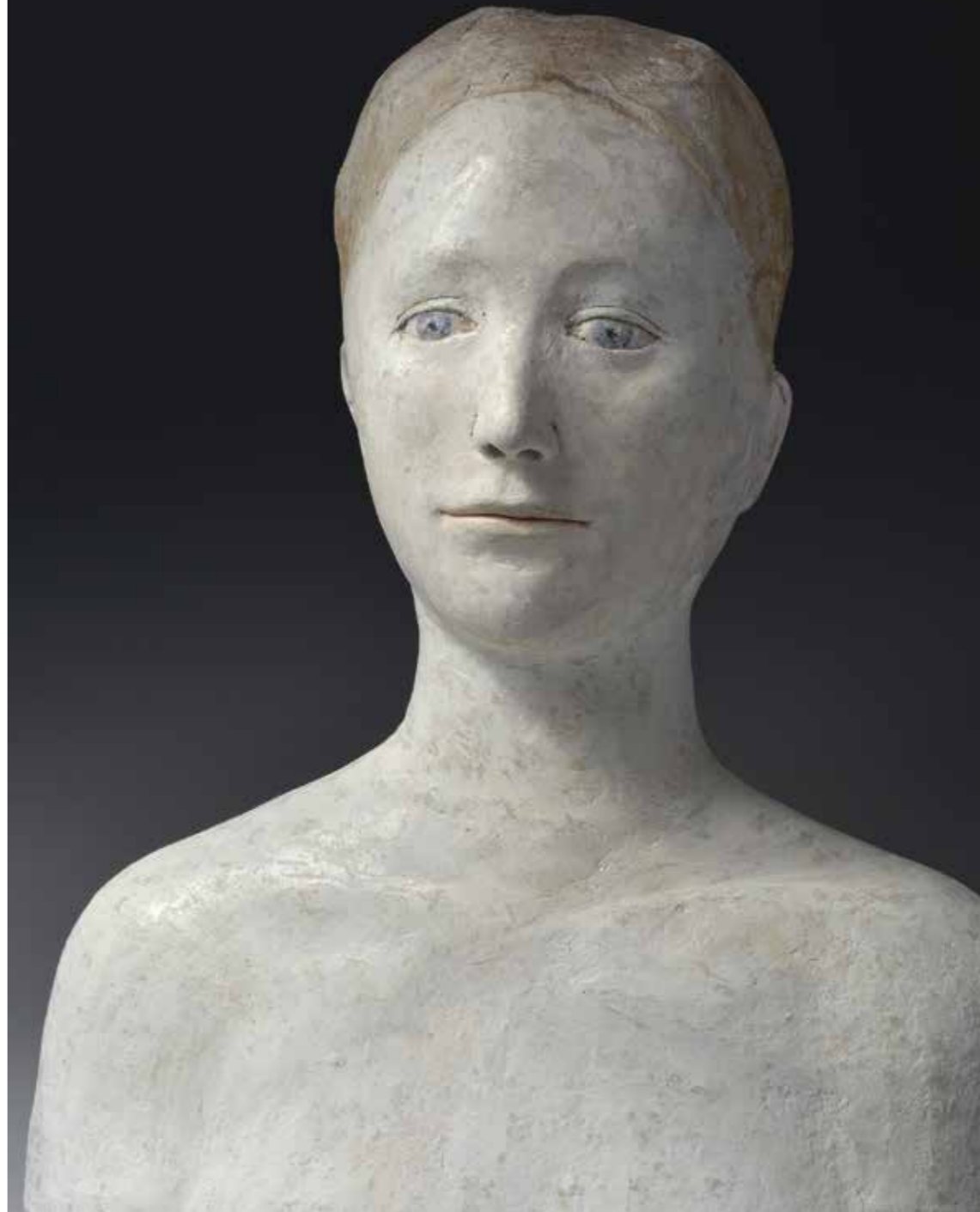
Grand buste de reine Papier mâché Hauteur : 53 cm Pièce unique