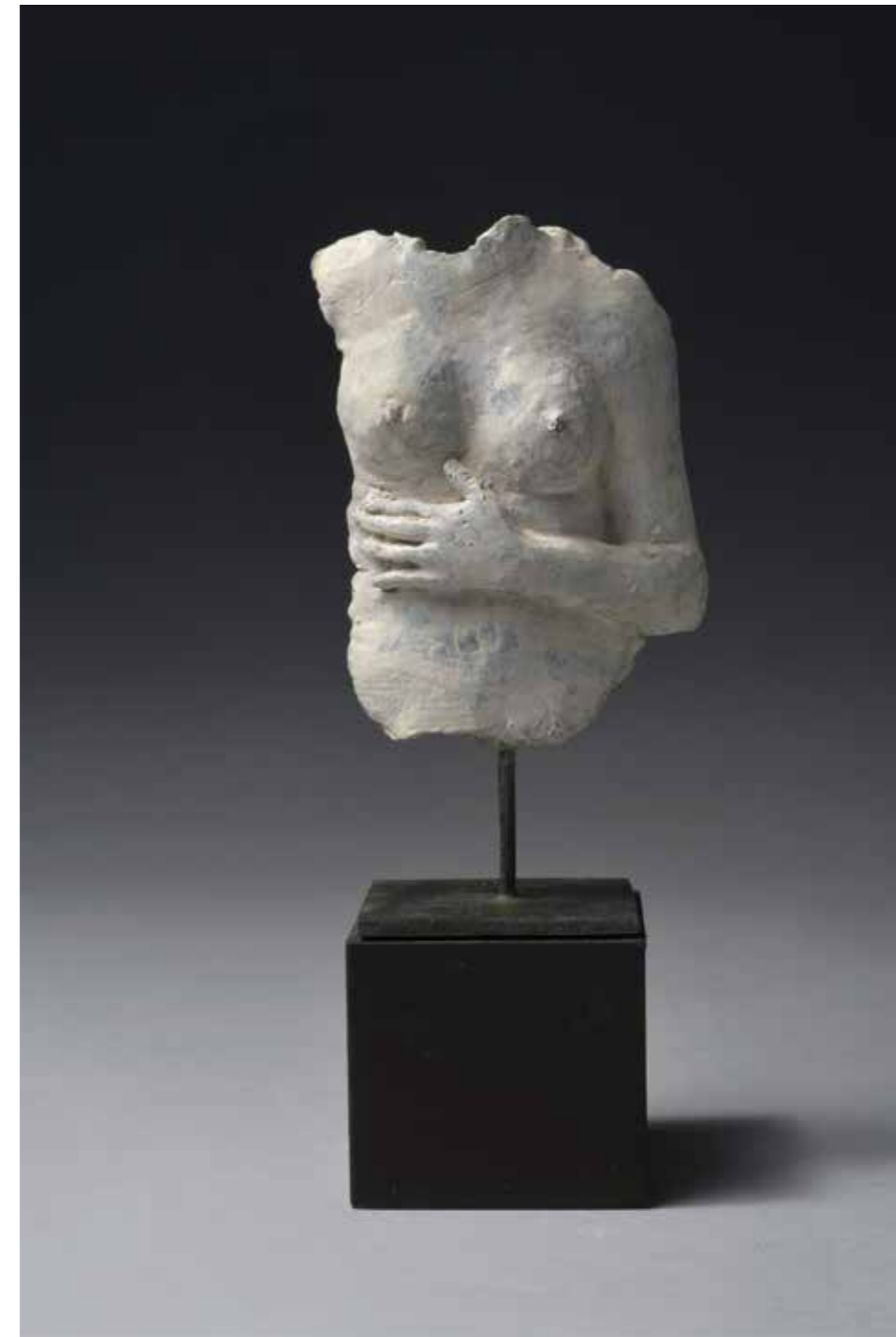
Fragment de buste sans tête Bronze Hauteur : 13 cm Pièce unique