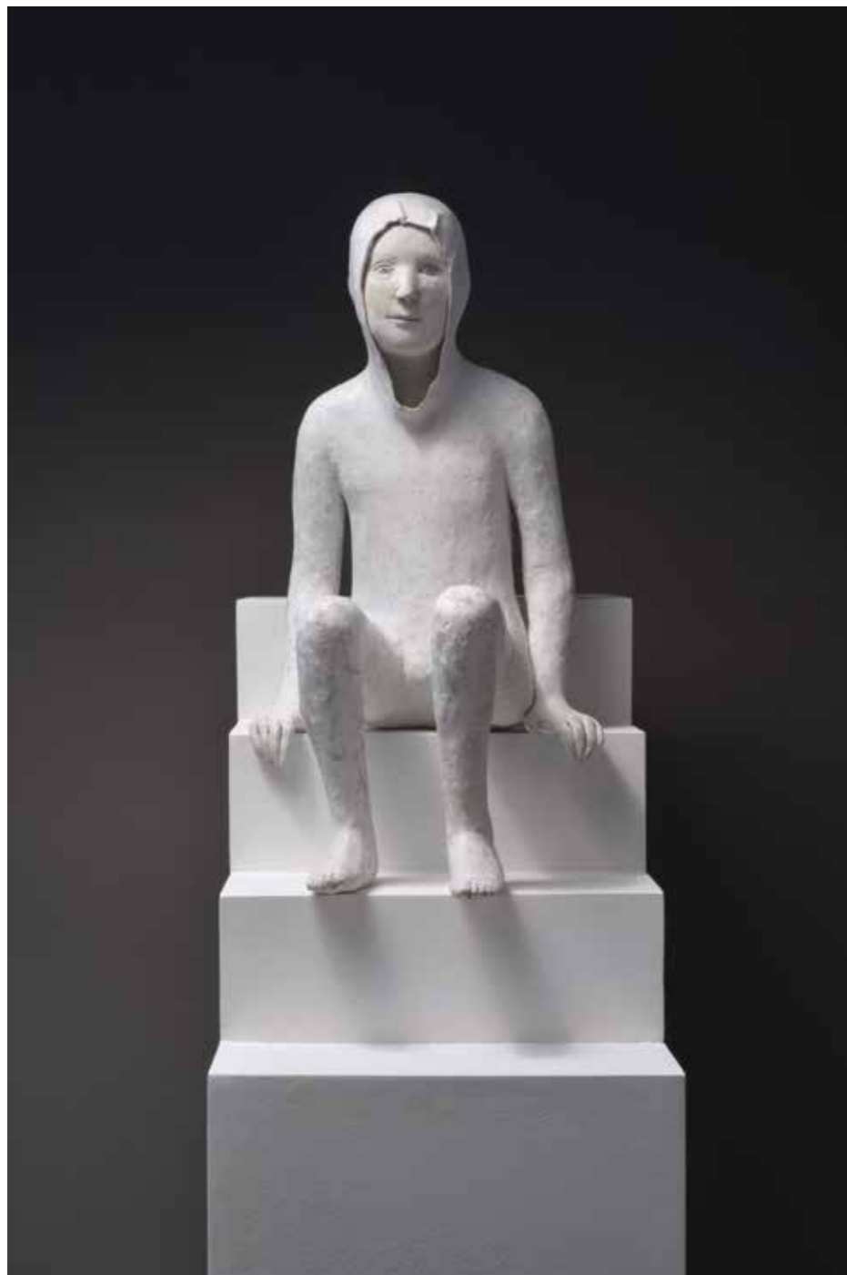
Grand jeune sur quatre marches Papier mâché Hauteur du personnage : 50 cm Pièce unique