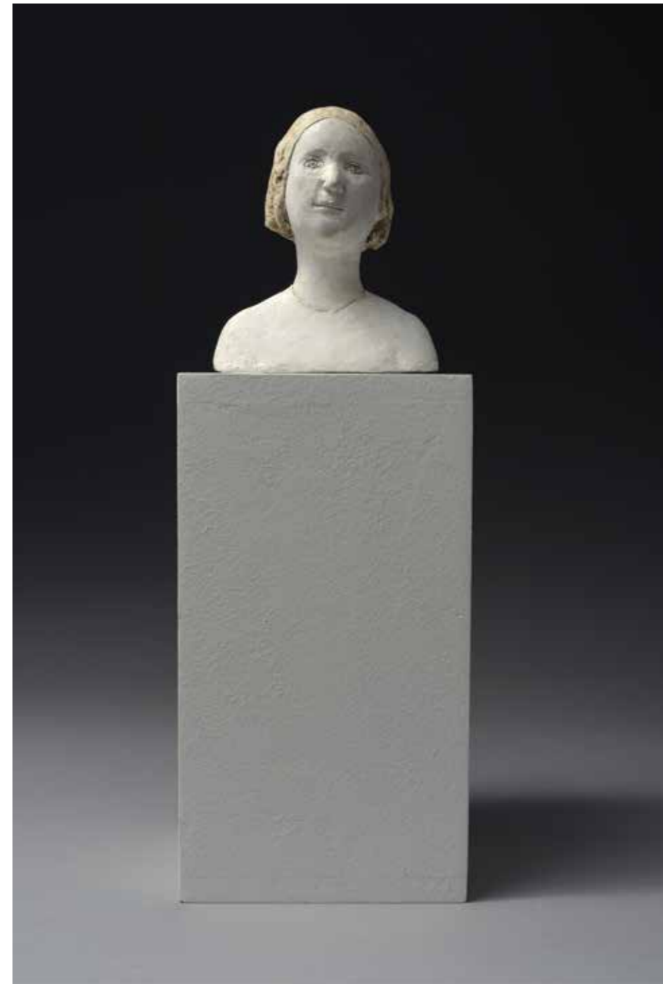
Petit buste de fille Papier mâché Hauteur : 11 cm Pièce unique