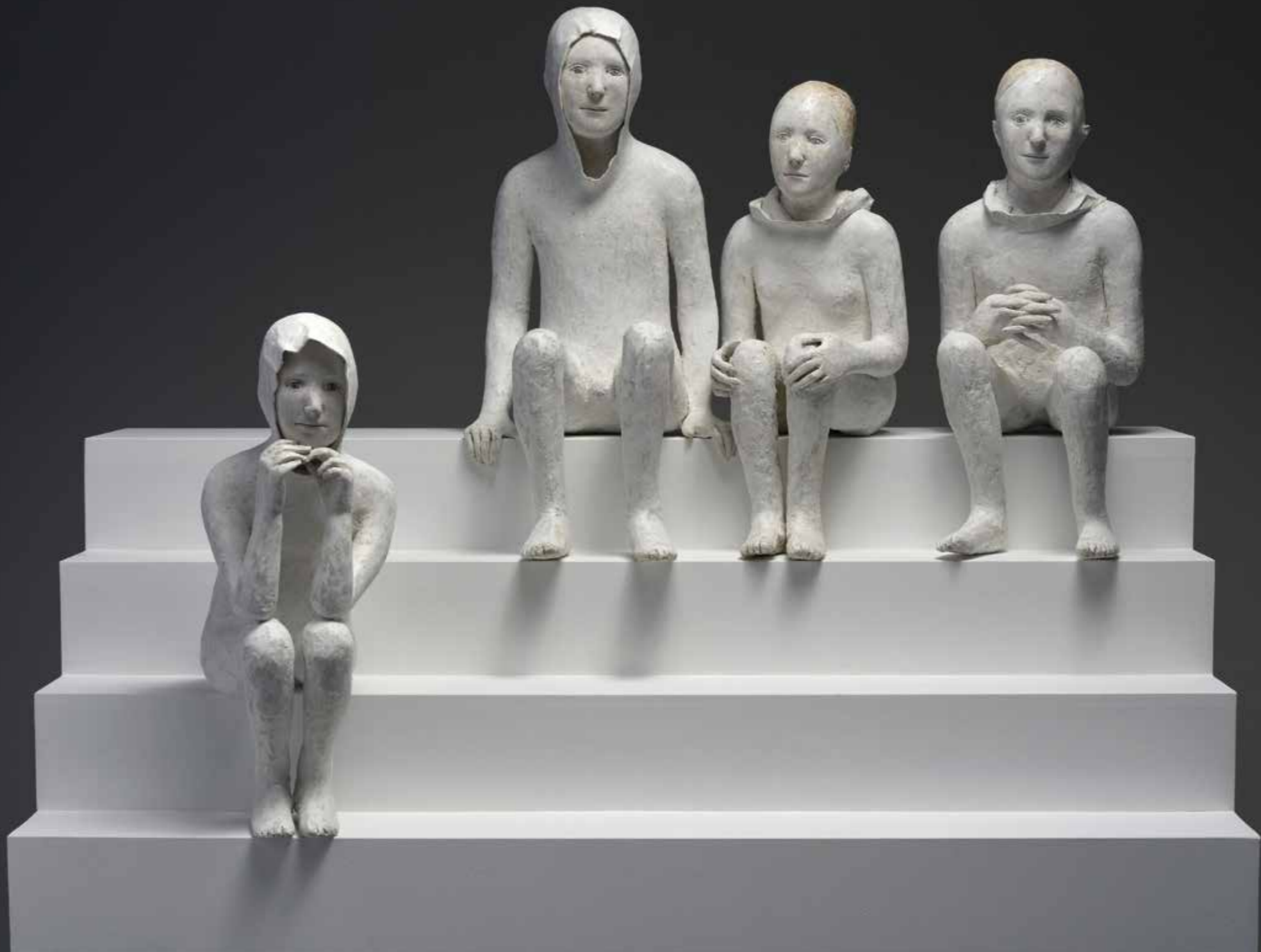
Quatre personnages sur un grand escalier Papier mâché Hauteur des personnages de 45 à 50 cm Pièces uniques