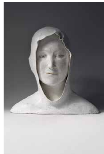
Grand buste de jeune Papier mâché Hauteur : 45 cm Pièce unique