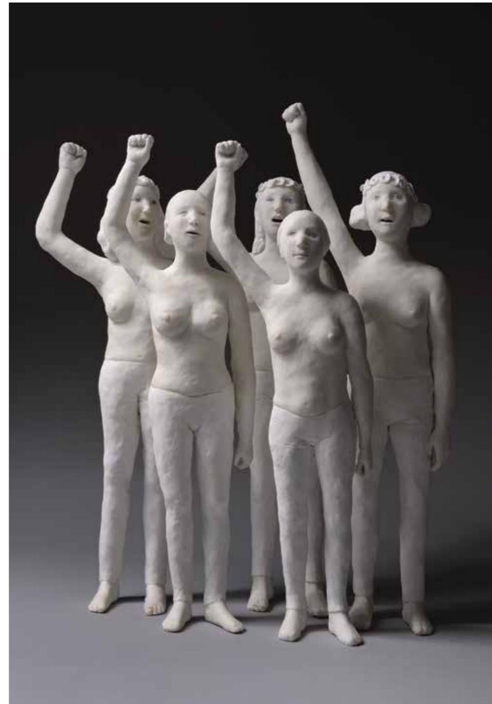
Groupe de fēmens pacifiques Résine Hauteur : 50 cm Pièces uniques