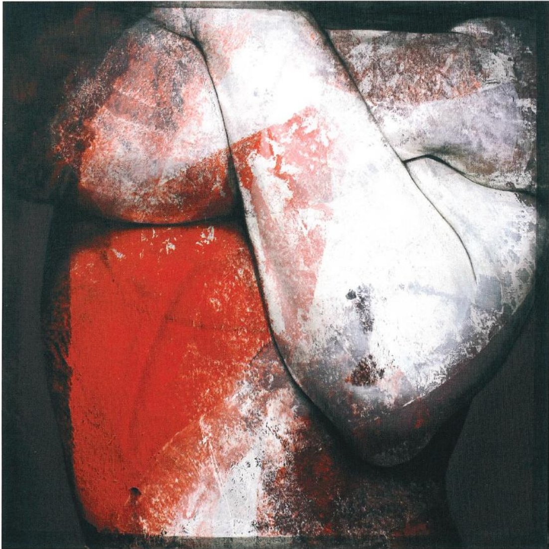
Bras rouge, techniques mixtes sur toile, 100 x 100 cm, 2016